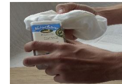
2. mit fusselfreiem Tuch dünn auftragen, 8–12 Std. trocknen lassen; vor Nässe schützen