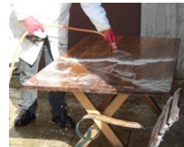
Mit Wasser abspülen / trocknen lassen