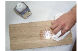
3. evtl. Glättschliff zweiter Auftrag