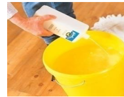
1:10 mit Wasser verdünnen

Rohe Holzoberfläche glätten Sie nach der Trocknung mit einem metallfreien Schleif-papier, Körnung 150. Nun kann der Oberflächenaufbau ausgeführt werden. Behandeln Sie vor der ersten Anwendung auf unbekanntem Untergrund eine Probefläche.